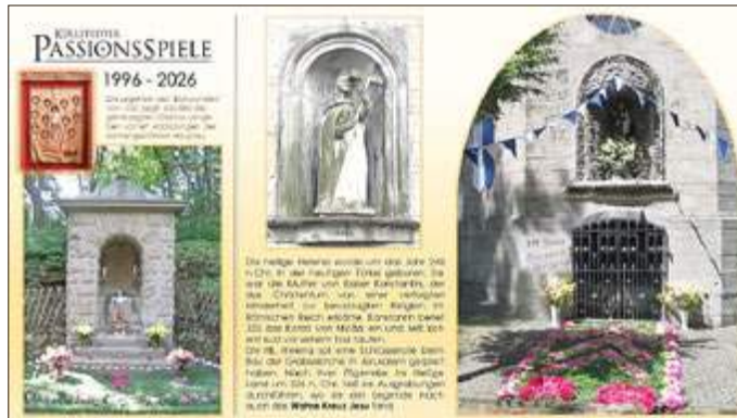
Die 14. Station des Küllstedter Freilandkreuzweges befindet sich mit der 'Grablegung Jesu' in der Ostfassade der Antoniuskapelle. Die einstige 'Grabeskapelle' war von 1846 (Einweihung) bis 1861 (Umwidmung) der Heiligen Helena geweiht, deren Statue noch heute über dem Portal der Kapelle zu sehen ist. An dieser Stelle soll gemäß der Chronik bereits im Jahre 1682 die Wallfahrt nach Walldürn in Folge der Pest '...verlobet' worden sein.