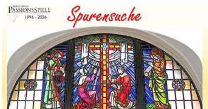
Hinweise auf das Passionsgeschehen finden sich auch in der Bleiverglasung des Portalfensters der Antoniuskapelle. Von innen betrachtet sieht man links eine Darstellung des Hl. Bonifatius, in der Mitte 'Maria und Johannes unterm Kreuz' und rechts dargestellt ist die Mutter des römischen Kaisers Konstantin, die Hl. Helena, mit einem Symbol der Kreuzauffindung in den Händen haltend.