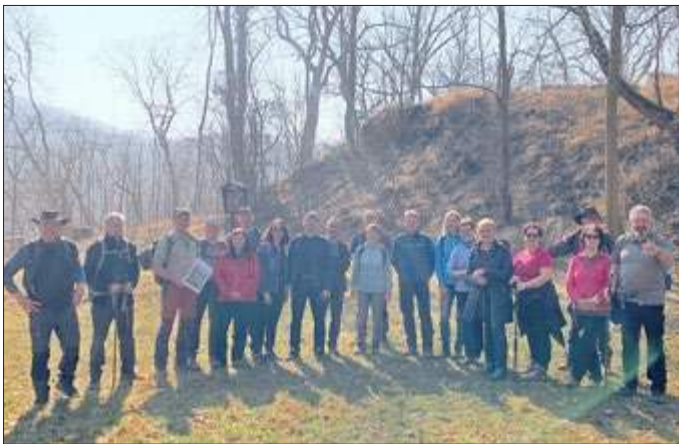
Rastplatz Burgruine Altenstein

Weiterhin ging es zur Rast bei der Ruine Altenstein, dem höchsten Punkt unserer Wanderung