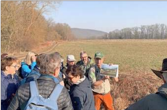
Entlang der ehemaligen innerdeutschen Grenze

Sperrgraben und Beobachtungsturm oder auch Kommunikationsbunker an die Teilung Deutschlands.