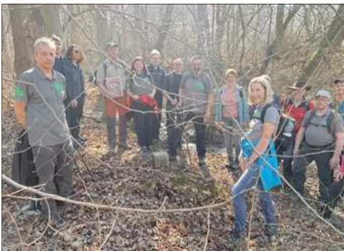
Stopp an einem Grenzstein entlang der innerdeutschen Grenze

Abwechselnd über thüringische und hessische Bereiche wanderten wir anschließend immer entlang der ehemaligen innerdeutschen Grenze zurück Richtung Grenzmuseum.