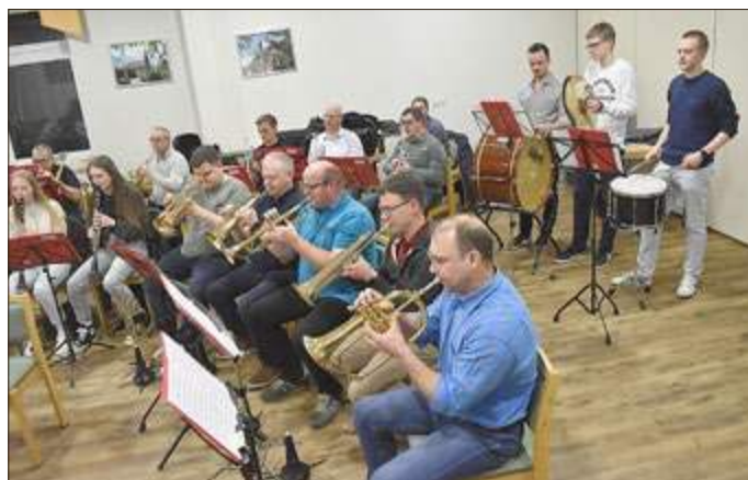
Die Musikerinnen und Musiker wollen auch mit neu arrangierten Stücken aufwarten.