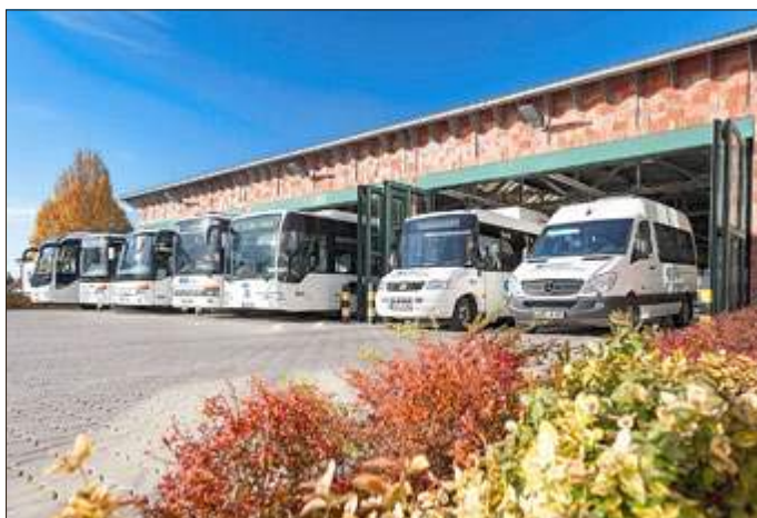
Betriebsgelände der EW Bus GmbH in Leinefelde