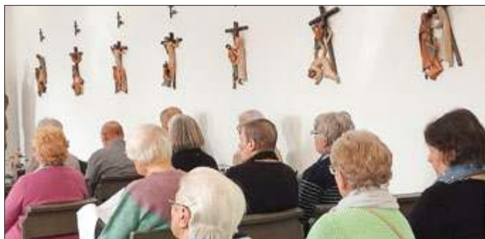
Kreuzweg in der Kapelle des Altenheims in Küllstedt